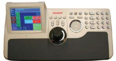
UltraKey Plus (HJK7000)