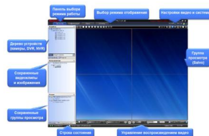
Интерфейс окна просмотра видео MAXPRO NVR SE