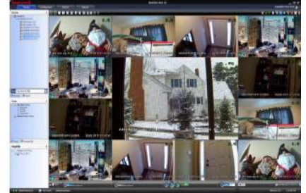
Комбинирование групп видеоизображений Video Surround